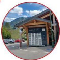
Place des Cantalouns à Lescheraines

Fruitière du cœur des Bauges sans oublier nos deux magasins