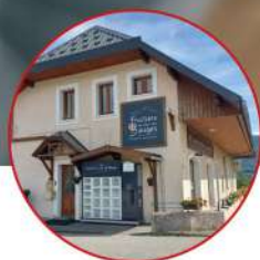
Coopérative Laitière de Lescheraines