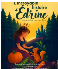
@La Comédie des Alpes