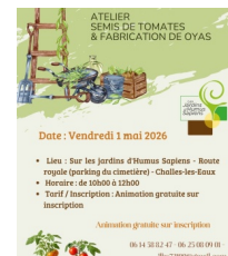
@Les jardins d'humus sappers

Atelier jardinage autour de pratiques simples et écologiques