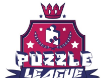
@La Grande Évasion