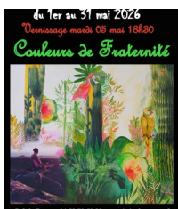
@secours catholique Chambéry