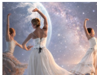
@Creat Danse 2026

https://ecoledansenedage.wixsite.com/danse