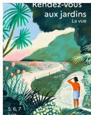
aux jardins

www.chambery.fr/204-les-musees-de-la-ville-de-chambery.htm