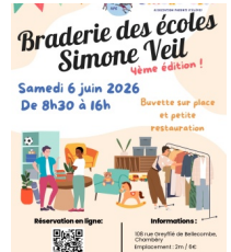
Simone Veil